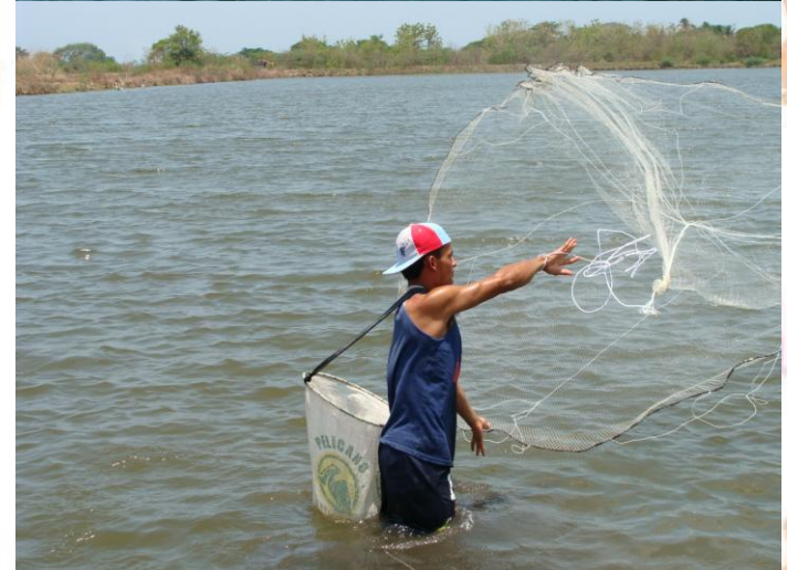
FAO-CENDEPESCA TCP 3201